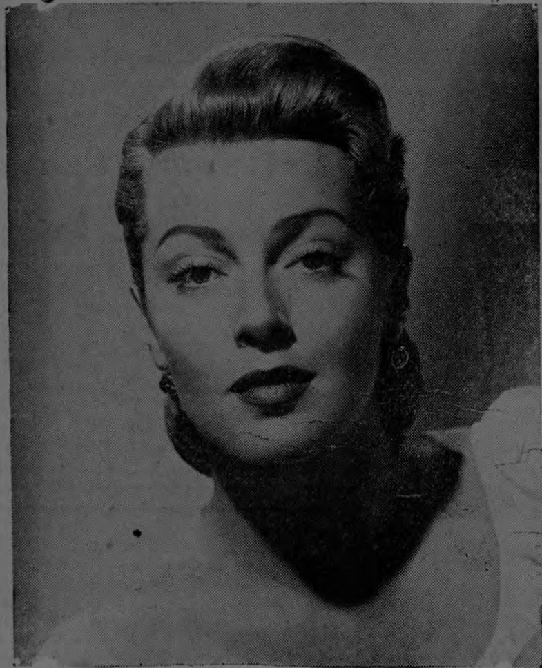
La adorable LANA TURNER, estrella de la M-G-M, prueba definitivamente, según el experto de Hollywood Max Factor Jr. que la salud papel de capital importancia en la belleza y seducción femeninas.

RECORTE ESTE ANUNCIO Y COLOQUELO JUNTO AL RADIO